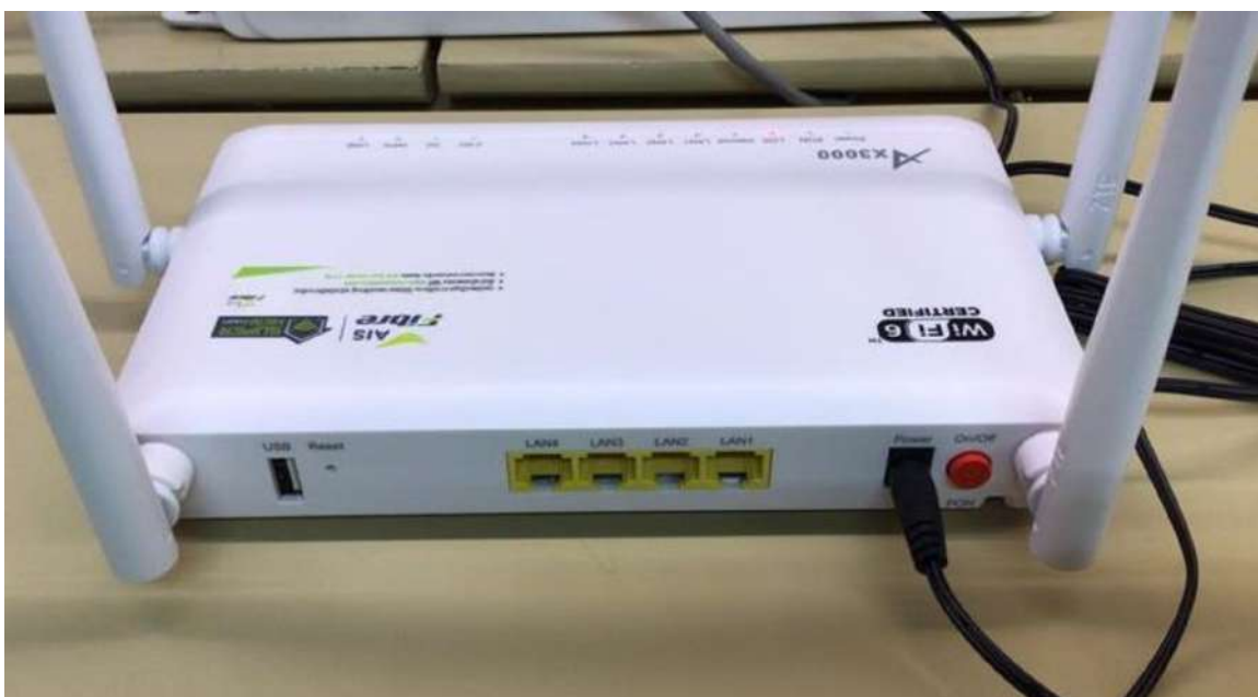
(ภาพด้านหลัง)