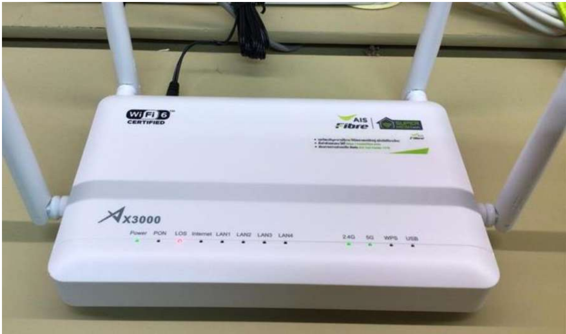
(ภาพด้านหน้า)